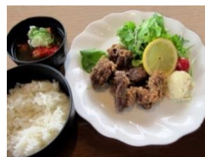
シカ竜田揚げ定食